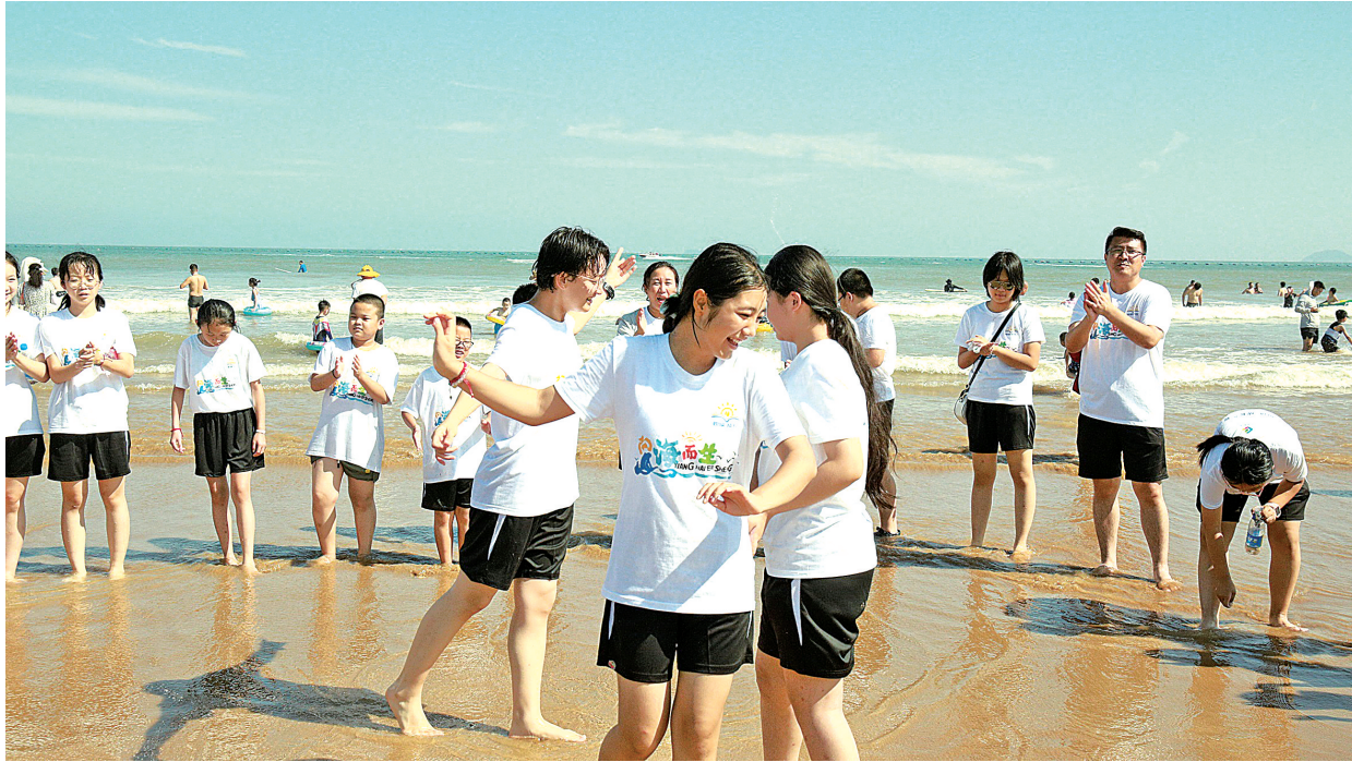
▲8月7日，十二师中小学生赴山东省夏令营访学团在海边领略海洋风光。

当同学们进入青岛海底世界82.6米长的海底隧道，漫步其中，海洋作伴，鱼儿变繁星，同学们仿佛化身海底精灵，尽览旖旎的水下世界。鱼群环伺，蝠鲼遨游、海龟徜徉、鲨鱼游弋……大家应接不暇，眼花缭乱。当看到娇小可爱的小鱼，忍不住想去摸摸一下；当看到身体硕大的鲨鱼朝着自己游过来，又下意识后退几步。这种近距离接触，让同学们互相交流着、讨论着，兴奋又激动，不停惊叹大自然的神奇。